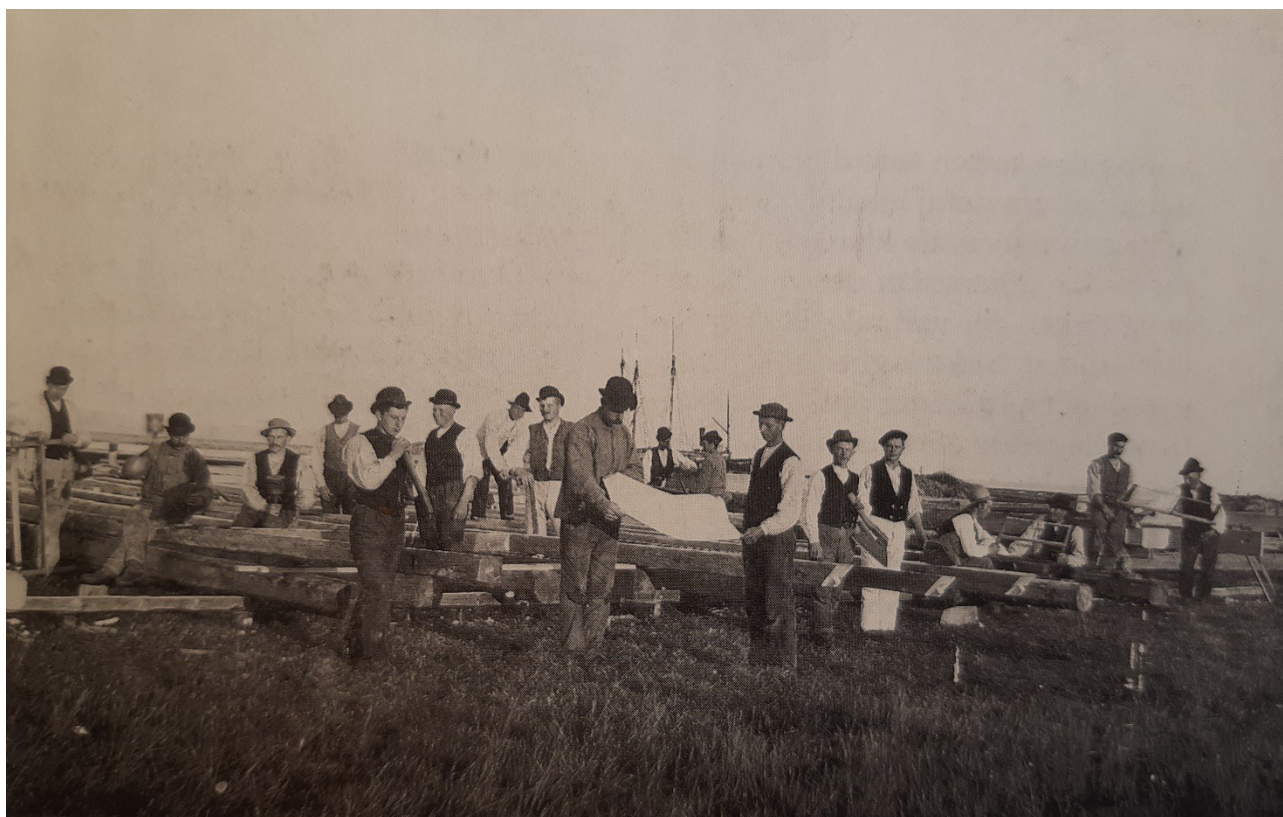
Fra anlæggelsen af Mandshjemmet 1899